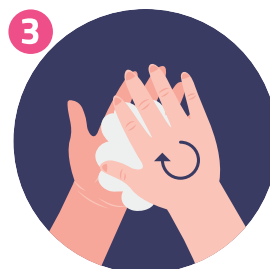
STROFINA LE MANI DA PALMO A PALMO RUB HANDS PALM TO PALM