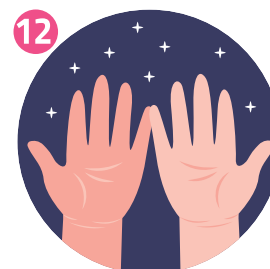
ORA LE MANI SONO PULITE YOUR HANDS ARE CLEAN