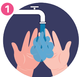
BAGNA LE MANI WET HANDS