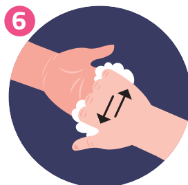
STROFINA LA PARTE POSTERIORE DELLE DITA SUL PALMO OPPOSTO RUB THE BACK OF FINGERS ON THE OPPOSING PALM