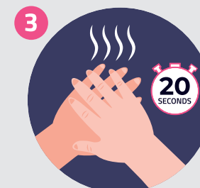
3 STROFINA SU TUTTA LA SUPERFICIE DELLE MANI FINO AD ASCIUGATURA DEL PRODOTTO COVER ALL SURFACES UNTIL HANDS FEEL DRY