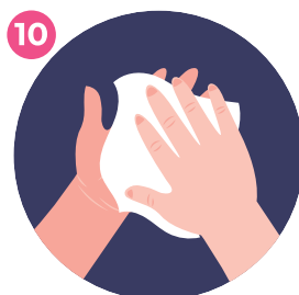
ASCIUGA CON UNA SALVIETTA MONOUSO DRY WITH A SINGLE USE TOWEL