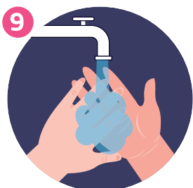
RISCIACQUA LE MANI RINSE HANDS