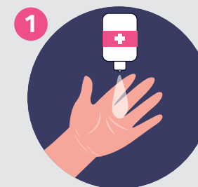
1 VERSA IL PRODOTTO SUL PALMO DELLA MANO APPLY THE PRODUCT ON THE PALM OF ONE HAND