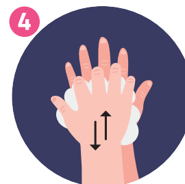
DOPO IL DORSO DI ENTRAMBE LE MANI LATHER THE BACK OF BOTH HANDS