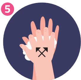
STROFINA FRA LE DITA SCRUB BETWEEN YOUR FINGERS