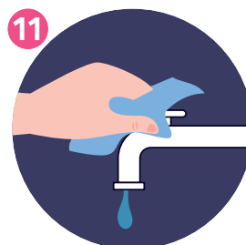
USA LA SALVIETTA PER CHIUDERE IL RUBINETTO USE THE TOWEL TO TURN OFF THE FAUCET