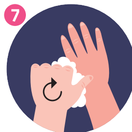
PULISCI I POLLICI CLEAN THUMBS