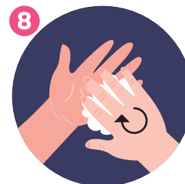
LAVA LE UNGHIE E LE PUNTA DELLE DITA WASH FINGERNAILS AND FINGERTIPS