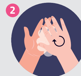
2 FRIZIONA LE MANI PALMO CONTRO PALMO RUB HANDS TOGETHER